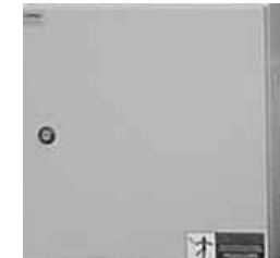
6 / 7